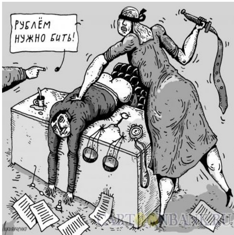
Лук'янченко Игорь © saftonbank.ru

на тым, што ён разам з сябрамі арганізацыі ўсклалі кветкі і запалілі знічкі на месцы пахавання ксяндза Адама Фалькоўскага. Была заведзена адміністрацыйная справа. Суддзя Сяргей Піпко адправіў пратакол на дапрацоўку.